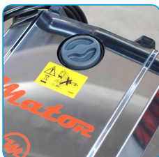
Cubierta de acero inoxidable