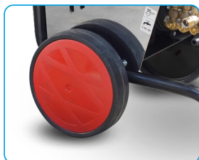
Ruedas de goma de gran diámetro para fácil desplazamiento